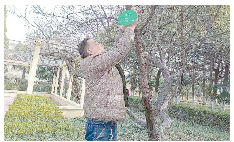
近日,市人民公园工作人员为园内的树木悬挂上了“身份证”。“身份证”上标有树木名称、科属、产地等信息。

垃圾清运工作没有节假日,多年来,马付岭已经习惯了这样的工作节奏。对于自己的工作,他有着满满的成就感。“垃圾清理干净了,路就干净了,大家从这里过,心里舒坦,我看着也高兴。”马付岭说。