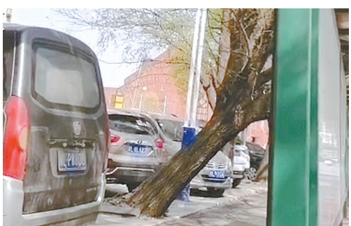
湘江路与柳江路交叉口,一棵行道树倾斜。