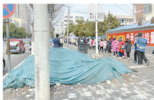
五一一路市第二实验小学附近,建筑垃圾未清理。