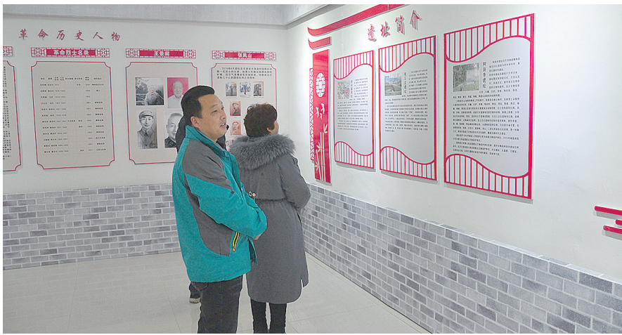
村民在党史馆参观学习。

盒、织布机、纺花车……乡情馆里,陈列的大多是村民们使用过的生活物品。村情馆则收藏着村民们捐赠的耙子、锄头、土犁、耩、铡草刀等几十种生产用