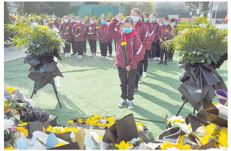
3月3日上午,召陵区实验小学师生代表到市烈士陵园悼念戍边英雄王焯冉。2月20日以来,全市已有170多个社会团体和19500多名社会各界人士,自发到市烈士陵园悼念王焯冉烈士。