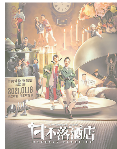
右图为《日不落酒店》剧照。