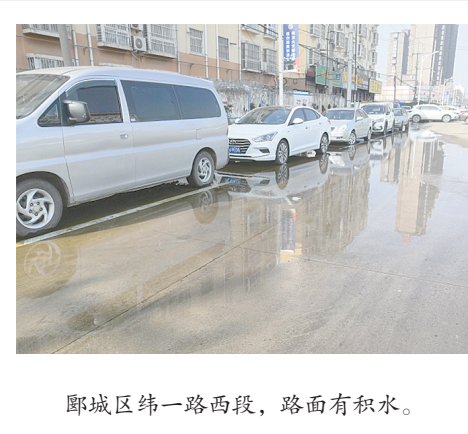
郾城区纬一路西段,路面有积水。