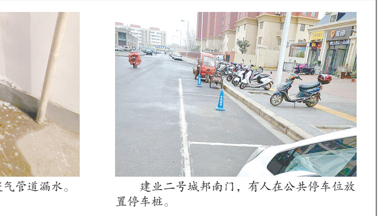
建业二号城邦南门,有人在公共停车位放置停车桩。