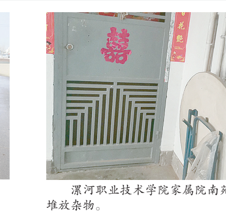
漯河职业技术学院家属院南苑新区,楼道堆放杂物。