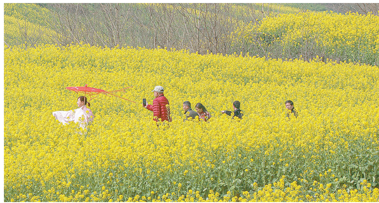
近日,油菜花竞相开放,把田野装扮得格外美丽。图为三月十四日,舞阳县莲花镇油菜花吸引游客驻足观赏。本报记者 杨光 摄