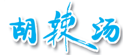
麻辣鲜香 开胃提神

为早日实现小学游泳课全覆盖,相关部门可以对我市现有的游泳场馆进行整合,给予相关的补贴,让游泳场馆乐于向学生开放。同时,政府部门也要加大资金投入力度,兴建一批新的游泳场馆。如此,才能让更多的学生掌握游泳这项技能。