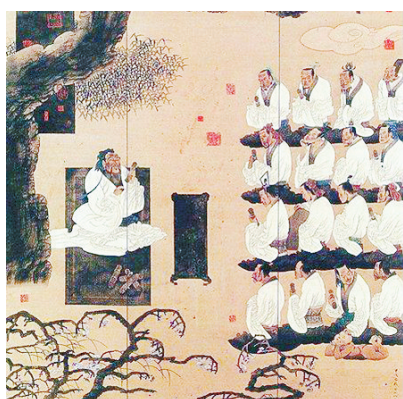
《孔子杏坛讲学图》局部。 孔维克 绘