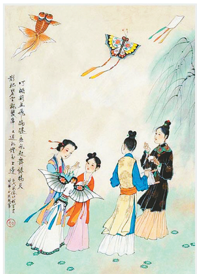
春分前后，正是出游放风筝的日子。 资料图片

俗话说：“春分麦起身，肥水要紧跟。”此时，春耕、春种的大忙季节就要开始了。春分过后，越冬作物进入生长阶段，应当加强田间管理。