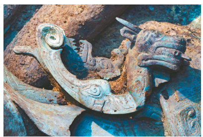
3号坑内青铜器上的龙形附件。