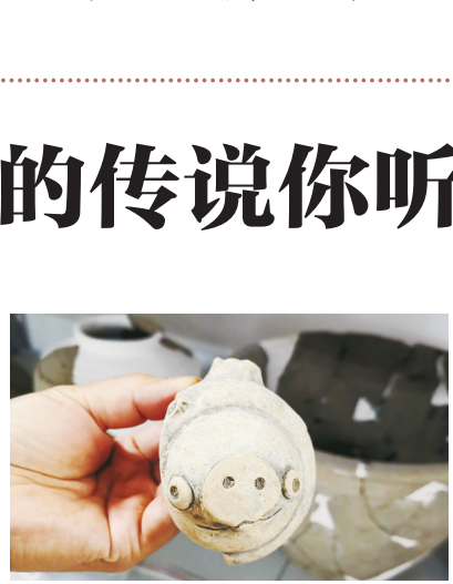
“愤怒的小鸟”同款猪。