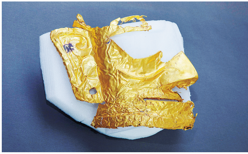
5号坑出土的残缺的金面具。

古蜀文明之光，再次闪耀于中华文明版图西南部。黄金面具、青铜尊、玉琮、玉璧、金箔、象牙……3月20日，“考古中国”重大项目工作进展会在成都举行，通报了四川广汉三星堆遗址重要考古发现与研究成果。新发现的6座三星堆文化“祭祀坑”，目前已出土500余件重要文物。 “沉睡三千年，一醒惊天下。”曾在1986年震惊世界的三星堆遗址，以辉煌灿烂的新发现“再惊天下”。