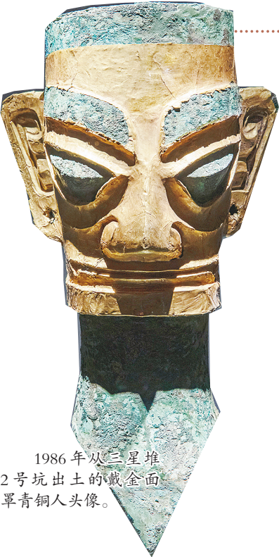
1986年从三星堆2号坑出土的戴金面罩青铜人头像。

传说一 三星堆是外星文明吗 硕大的耳朵、前凸的双眼、咧到耳根的大嘴巴……有人认为，三星堆是外星文明，三星堆诡异诡谲的青铜纵目面具、青铜大立人、青铜神树等文物是外星人的作品。 对此说法专家坚决反对！以三星堆为代表的古蜀文明是中华文明起源