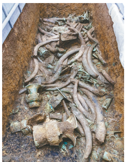
3号坑内的各种青铜器和象牙。