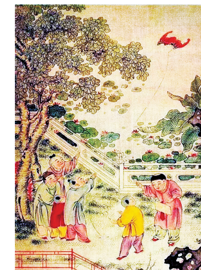
《百子团圆图册》 焦秉贞 绘

尚任曾为无风放风筝而焦虑不安：“人人夸你春来早，欠我风筝五丈风。”明清时期，风筝的制作、装饰技艺空前发展，清明时节，郊外踏青放纸鸢渐成一种风尚。文人贤士更是热衷把亲手制作的风筝赠予友人，并将其视为一项文雅的交流互动。