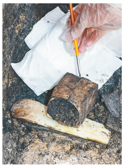
4号坑内发掘出一枚玉琮。