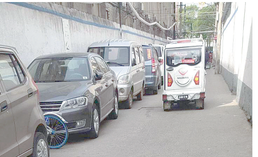
昆仑路芙蓉里小区，车辆占用消防通道。