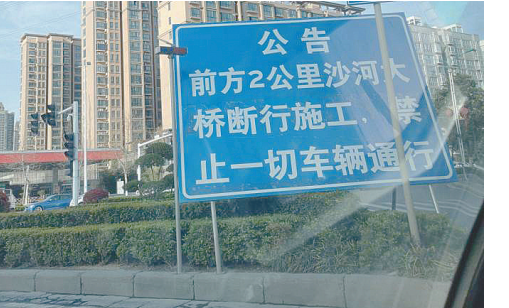
白云山路与长江路交叉口，一道路施工标牌应该取消。