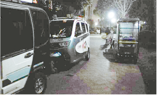
淞江路嘉业城市花园一期，电动三轮车乱停乱放。