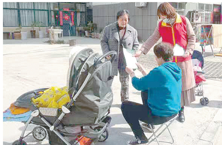
3月24日，沙北街道泰山社区工作人员开展文明祭祀宣传。

宋青顺带领农民工走南闯北，建起的大楼上百座，没出过一起质量事故和安全事故。2016年，宋青顺参与河南农业开发有限公司食用菌扶贫产业园建设。他利用自身技术，使4个规模超百座的食用菌扶贫产业园当年建成、当年见效。宋青顺还自学香菇种植技术，把园区治理得井井有条，经济效益逐年攀升，并开办“乡村课堂”，教农民朋友种植食用菌，受到了公司和当地群众的一致好评。