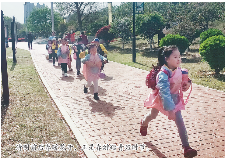
清明前后春暖花开,正是春游踏青好时节