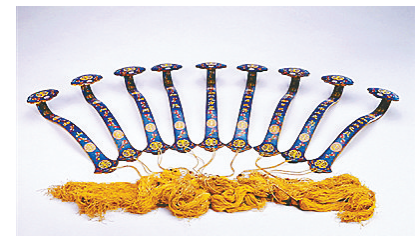
掐丝琅天保九九如意。