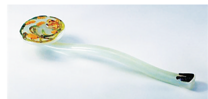
白玉嵌彩石鹤鹑如意。