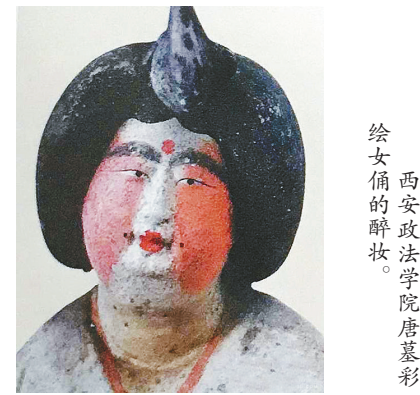
西安政法学院唐墓彩