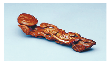
金星玻璃灵芝式如意。

可见，无论是中国还是印度，“如意”这一器具的发明和使用都至少有几千年的历史了，在漫长的历史进程中，其形制不断发生变化，一部分做工精美的从实用器变成了陈列器，如意也与痒痒挠分道扬镳了。从实用器向陈列器转化的背后是历史的发展与