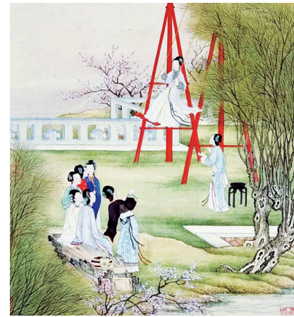
《月曼清游图册》 陈枚 作

《清宫述闻》载：“翊坤宫廊下有秋千，今尚存。”至今翊坤宫的廊下仍留有当年悬挂秋千的大铁环。故宫博物院收藏有一件清晚期的木秋千，想必当年后妃们也曾嬉戏其上吧。