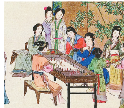
《姚大梅诗意图》(局部) 任熊 作

双陆是中国古代的一种棋类游戏，也叫“握契”“长行”。双陆的棋盘有双门，每边12陆，12陆中又分左右6陆。配有两色各15枚棋子和两个骰子。