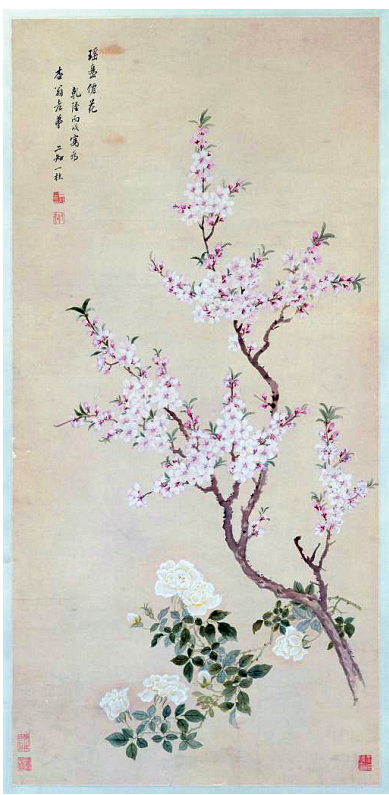
《桃花图》 邹一桂 作

先秦《诗经·周南·桃夭》里有一句脍炙人口的“桃之夭夭，灼灼其华”，诗篇贺的是新婚、描绘的是新娘嫁，而用来映衬这喜庆场景的，便是绚丽的桃花。