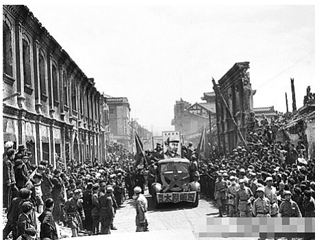
群众庆祝太原解放。

时间：1948年10月5日~1949年4月24日 地点：太原市 双方：解放军华北野战军，国民党晋系军阀。 结果：全歼守敌10余万人，拔除了国民党反动统治在华北的最后堡垒。 意义：太原战役的胜利，标志着山西全省解放，结束了阎锡山对山西省长达38年的统治。太原的解放，标志着华北地区的彻底解放，推动了全中国解放战争的进程。