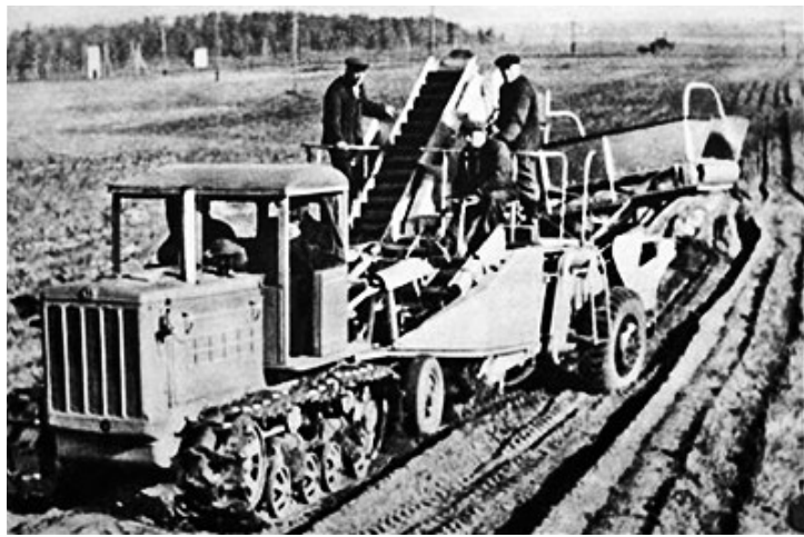
20世纪50年代，苏联大量开垦荒地以求粮食增产。

大规模采购的成功让苏联在两国第二轮博弈中赢回一局，让美国政府“吃了大亏”。苏联的大量采买行为间接导致美国内农产品和肉类价格大幅上涨，其中肉价上涨36%以上，国际粮食价格也上涨50%。这让美国政府大为光火，随即出台对苏联粮食出口禁令，要求出口量超过800