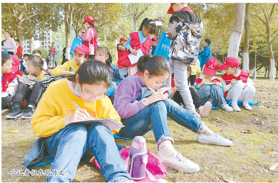
小记者们在写作文。

■文图 本报记者 王培 一边在风景秀丽的景区畅游,一边听着老师的讲解,用手中的笔书写美丽的春景……4月10日下午,漯河日报社300多名小记者来到市区漯河路附近的沙澧河风景区,跟着漯河日报教育综合体魏老师作文培训学校的老师游览美景、学习写作。 当天下午,许多小记者早早来到集合地点,兴奋地等待着活动的开始。下午三点,小记者们集合后,在老师的带领下,沿着河堤边走边欣赏沙澧河风景区美丽的景色。微风吹来,垂柳在风中舞动;樱花展露娇俏的容颜,各式各样的花儿在明媚的阳光下绽放…… 此次活动的主题是“寻觅春天,尽书诗篇”。老师用幽默风趣的语言引导小记者们从看、听、想等方面仔细观察春天,并教他们运用比喻、拟人等修辞手法来描写更加生动形象,用