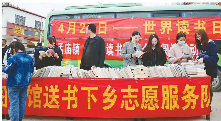
4月23日,郾城区图书馆在孟庙镇西营村举办送书下乡活动。