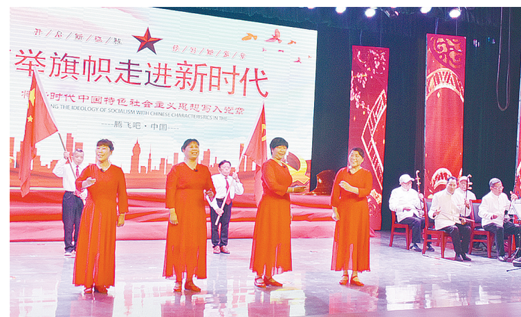
4月22日,由市残联举办的“红心向党 致敬百年”第五届残疾人文艺汇演在市老干部活动中心举行。