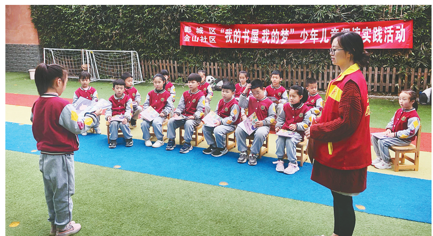
4月23日,郾城区沙北街道金山社区联合辖区文德双语幼儿园举办“我的书屋 我的梦”阅读活动。

当天举行的一系列系列活动,弘扬了尊重知识、崇尚读书的理念,营造了良好的阅读氛围。