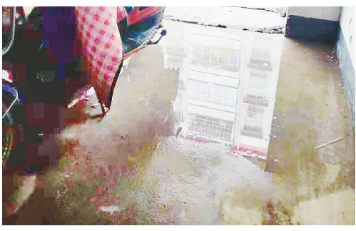
海河小区5号楼楼道口有积水。