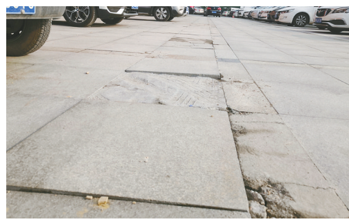
未来花园小区门前,地砖松动。