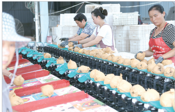
顺祺农业合作社工人们在分拣蜜梨