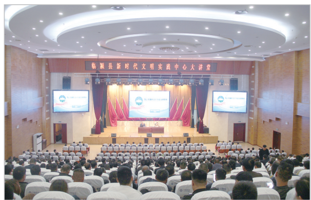
新时代文明实践中心大讲堂

发展质量显著提高,综合实力晋位跃升。 发展进入新常态,经济“换挡不失速”。生产总值年均增长7%;固定资产投资保持年均两位数增长;一般公共预算收入年均增长10%,是2015年的1.6倍;居民人均可支配收入是2015年