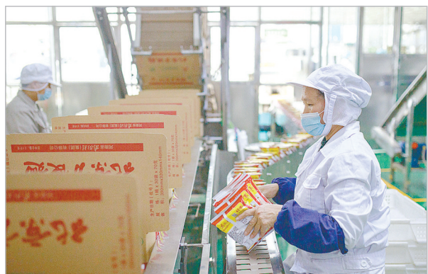
临颍县南街村方便面生产车间内工人们正在忙碌