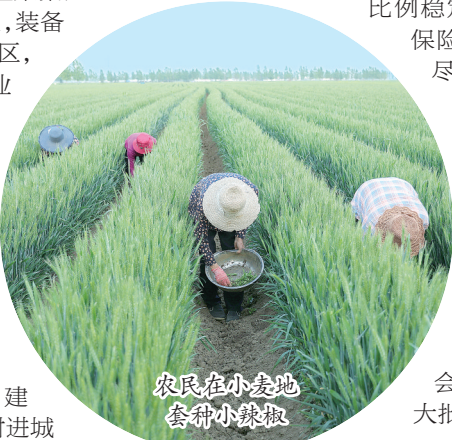
农民在小麦地套种小辣椒

发展红利加速释放,民生改善成效更大。 财政民生支出累计156.1亿元,占一般公共预算支出比例稳定在85%以上。基本养老保险、基本医疗保险实现应保尽保,特困供养、城乡低保、孤儿养育、高龄津贴等提标扩面。新建城区学校7所、新增学位2万个,新建、改(扩)建农村学校74所,义务教育阶段“大班额”问题基本消除。3所县级医院全部成功创建二级甲等医院,走在了全省各县前列,社会福利中心、疾控中心等一批民生项目建成投用。生态