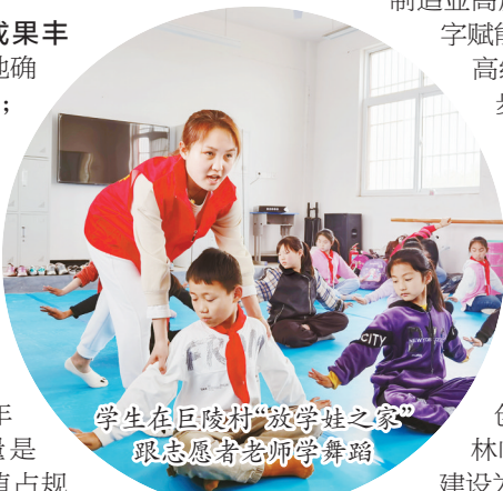
学生在巨陵村“放学娃之家”跟志愿者老师学舞蹈