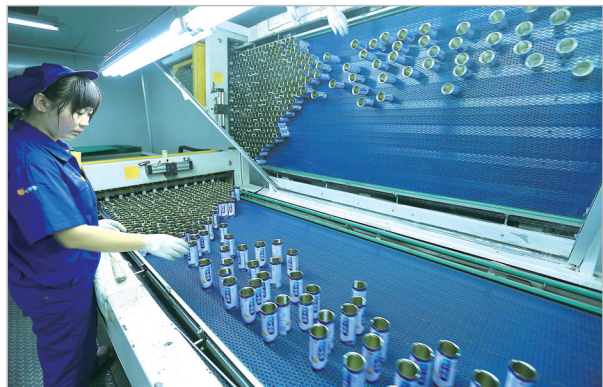
繁忙的嘉美印铁制罐车间