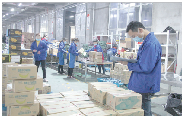
豪峰食品电商分拨中心工人正忙着发货