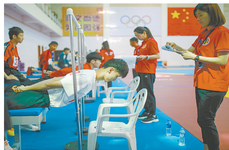
5月10日，第十四届全国运动会跆拳道项目资格赛体能测试在市体育馆举行。图为背肌耐力测试。

新闻直通车 0395-3139148 15939503609 电话一响 记者到场