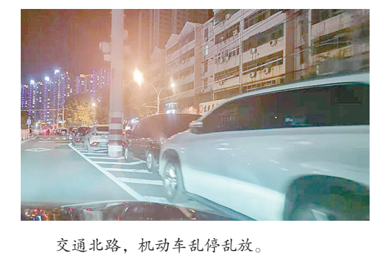
交通北路，机动车乱停乱放。