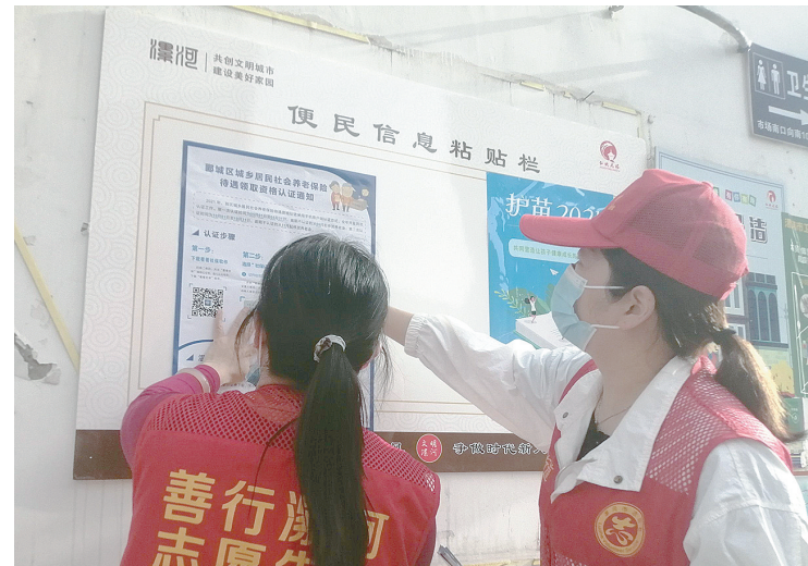
5月7日，郟城区龙塔街道华山路社区组织志愿者，对背街小巷的小广告进行了清理。