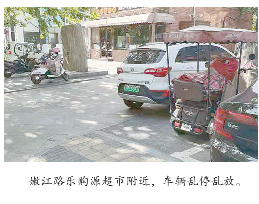
嫩江路乐购源超市附近，车辆乱停乱放。