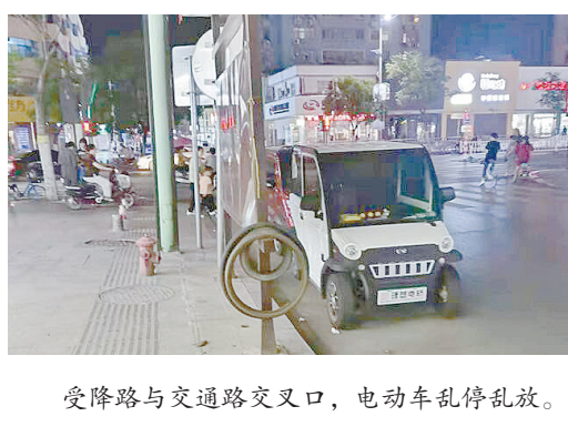
受降路与交通路交叉口，电动车乱停乱放。