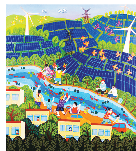
舞阳农民画 光“福”村头欢乐多 张淑平 作