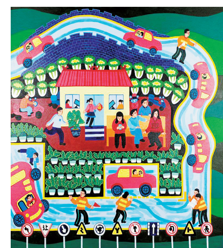
舞阳农民画 新春练车场 刘志刚 作