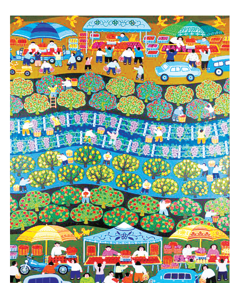
舞阳农民画 田间地头 武天军 作