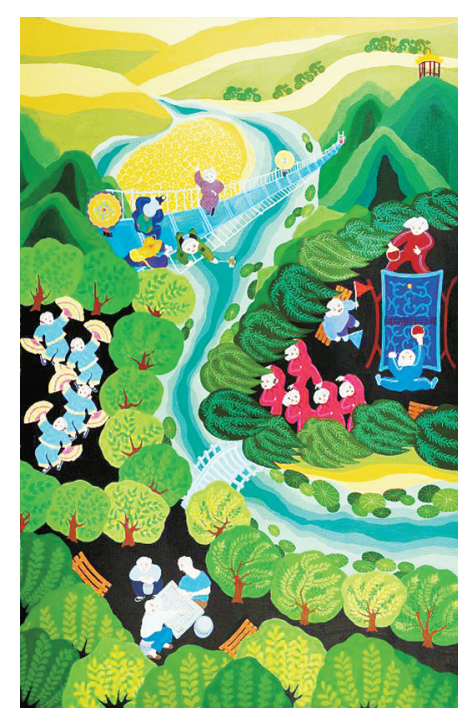
舞阳农民画 大地春早 马小姐 作

河南私立崇义中学的校址一直保留到20世纪70年代,现虽然无存,但作为红色教育基地,它将永远活在诞生地——源汇区大刘镇大陈村的村民心中。