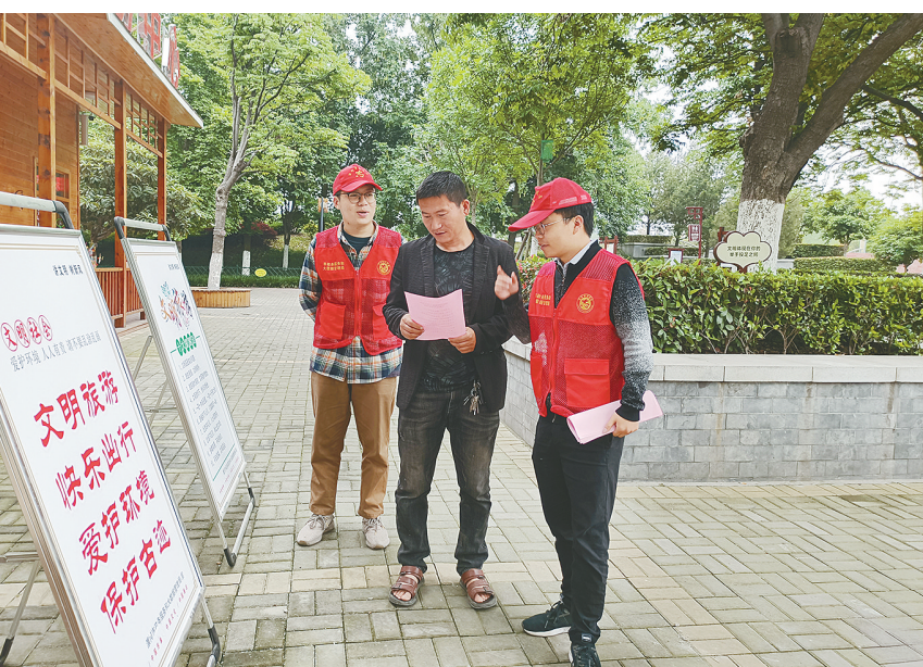
5月19日是第10个中国旅游日。为增强市民文明旅游意识,推动旅游产业健康快速发展,当天上午,市政务服务和大数据管理局、市大数据中心的志愿者,到红枫广场开展文明旅游宣传志愿服务活动。