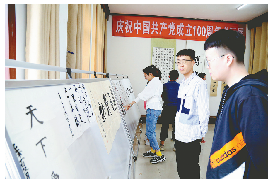
为传承好、发扬好党的优良传统,展现全市水利干部职工的良好精神风貌,5月18日,市水利局举办了“颂百年风华 兴千秋伟业”庆祝中国共产党成立100周年职工书画展。