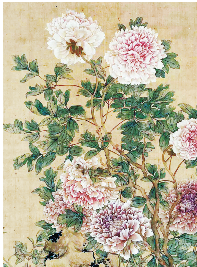
《牡丹图》(局部)。 恽寿平 作

在唐人的眼里牡丹是美的化身,是纯洁与爱情的象征。李商隐有《牡丹》诗云:“锦帏初卷卫夫人,绣被犹残越鄂君。垂手乱翻雕玉佩,折腰争舞郁金裙。石家蜡烛何曾剪,荀令香炉可待熏。我是梦中传彩笔,欲书花叶寄朝云。”全诗构思巧妙,借物比人,又以人拟物,借咏牡丹抒发诗人对意中人的爱慕、相思之情,暗示意