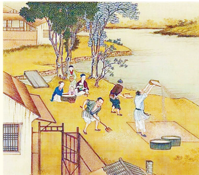
清代陈枚彩绘本《耕织图》。

《朱子家训》中说,“一粥一饭,当思来之不易;半丝半缕,恒念物力维艰”。崇尚节俭、珍惜粮食是中华民族的传统美德。古人很早就意识到天下之事,常成于勤俭而败于奢靡。他们当年如何节约粮食、惩治浪费行为呢?