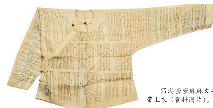
写满密密麻麻文字的夹带上衣（资料图片）。