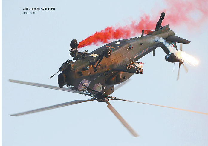
直-10武装直升机倒飞时发射干扰弹。