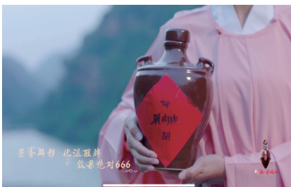
《端午奇妙游》节目剧照。