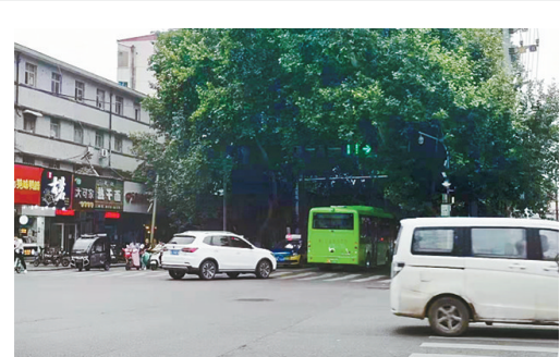
交通路与滨河路交叉口往东方向，红灯不亮。