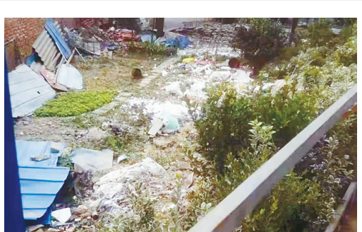
辽河路与太白山路交叉口东北角，沐裕盆景区花木园内垃圾遍地。