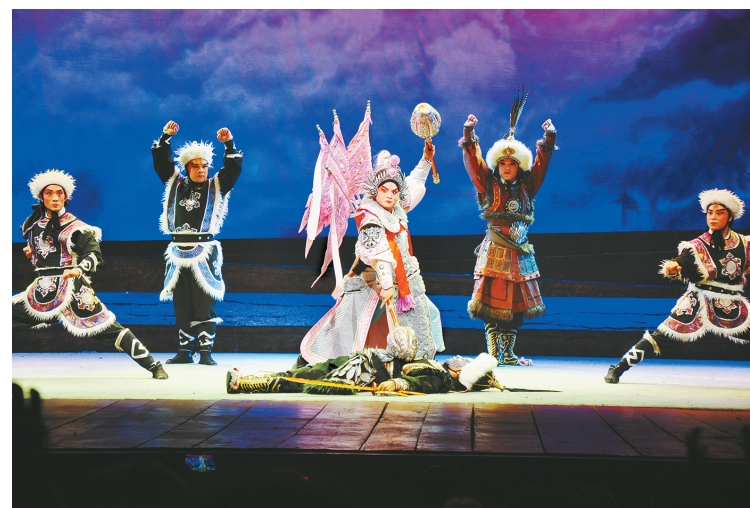
6月16日晚，为庆祝党的百年华诞，市豫剧团沙河调文武大戏《郾城大捷》在市人民会堂上演。