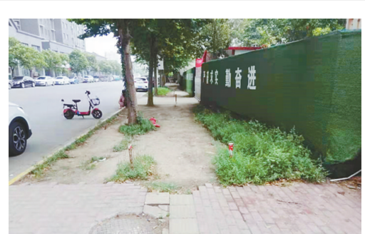
源汇区教师进修学校门前，人行道未硬化。