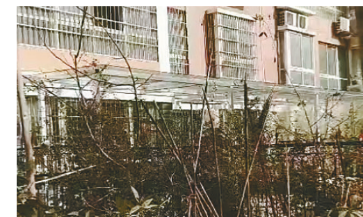
香堤左岸小区1号楼2单元,有人私搭乱建。