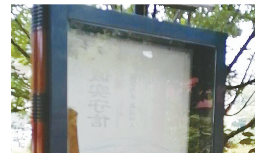
嵩山路与沙北路交叉口附近,一处公益广告破损。