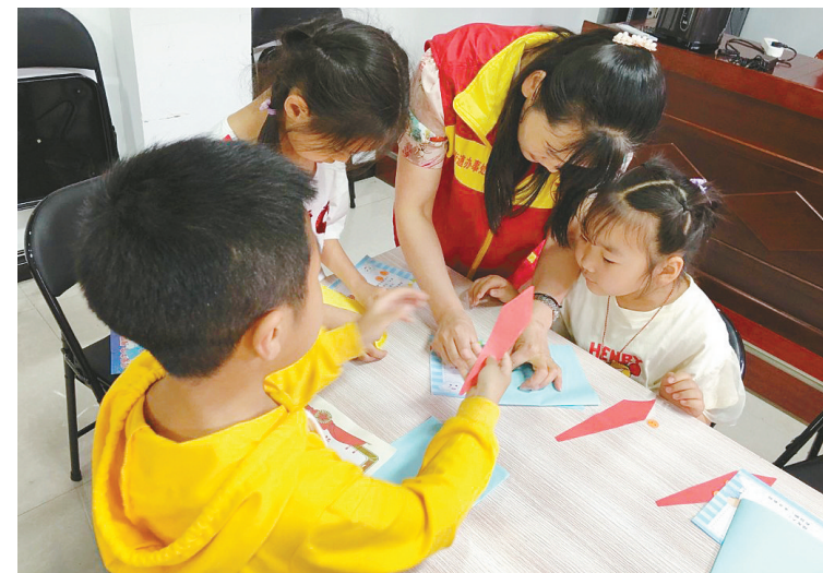
6月19日,郾城区沙北街道嵩山社区组织孩子们举办“爱你在心中 感恩父亲节”主题活动。孩子们为各自的父亲制作了礼物。

市市场监管局12315指挥中心接到李先生的投诉后,将该投诉件转至源汇分局干河陈市场监管所,安排工作人员处理。经过工作人员的解释,商家同意按原设计尺寸进行更换,纠纷得到化解。