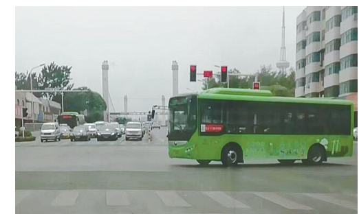
人民路与泰山路交叉口,左转弯灯只有15秒,时间太短。