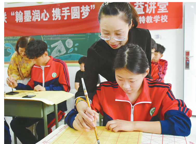
6月18日下午,市残联在市特殊教育学校开设“翰墨润心 携手圆梦”书法公益课,邀请市许慎印社的书法名师为孩子们上课。

“空家郭镇目前有161名党龄在50年以上的老党员。仪式启动后,我们将尽快把‘光荣在党50年’纪念章送到老党员手中,把党中央的关怀及时传递给每一名老党员,让他们在建党百年之际感受崇高的政治荣光。”空家郭镇党委书记王耀彬说。