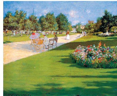
威廉·切斯《一个城市公园》

20世纪美国画家威廉·切斯的这幅作品展现了一个典型的纽约市内的夏天。在切斯的画中，绿地与光秃秃的路面形成了对比，凸显了夏日的阳光与活力。