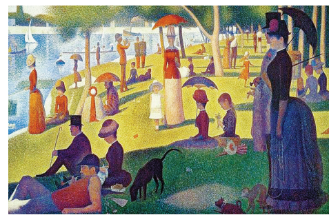
乔治·修拉《大碗岛的星期天下午》

这一名作描写了人们在塞纳河阿尼埃的大碗岛上休息度假的情景：阳光下的河滨树林中，人们在休憩、散步、垂钓，河面上隐约可见有人在划船，午后的阳光拉下人们长长的身影。修拉采用了点彩画法，画面宁静而和谐。