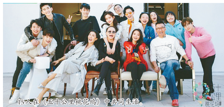
15人在《五十公里桃花坞》中共同生活。