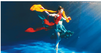
水下舞蹈《洛神水赋》演绎绝美“洛神”。