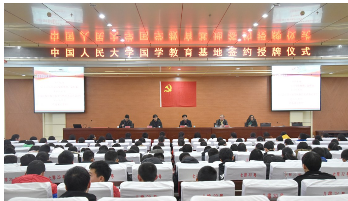
中国人民大学国教教育基地签约授牌仪式