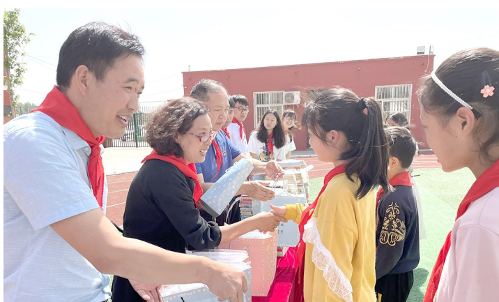
欢迎“六一”圆梦微心愿