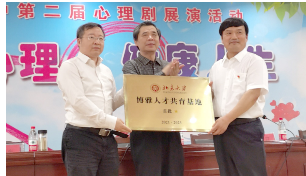
北京大学首批博雅人才共有基地授牌仪式