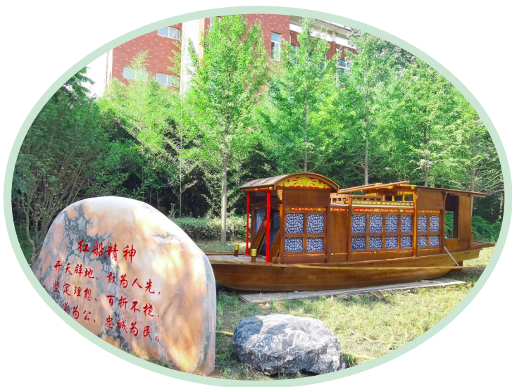
红色文化园——红船精神