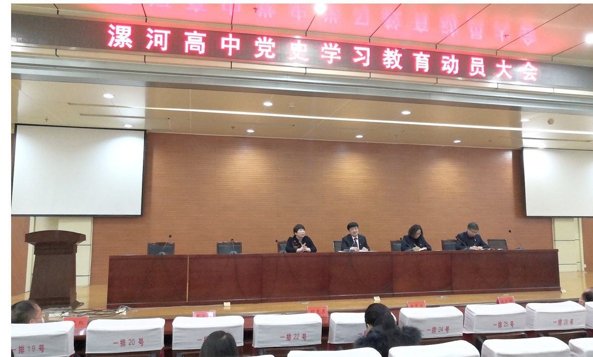
党史学习教育动员大会