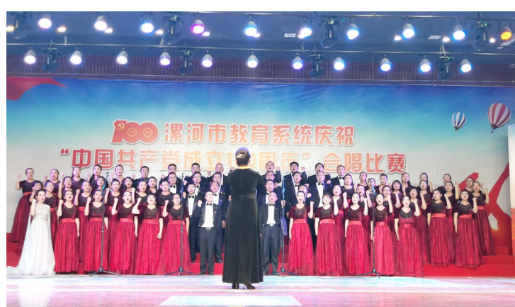
组织教职工参加教育系统红歌比赛