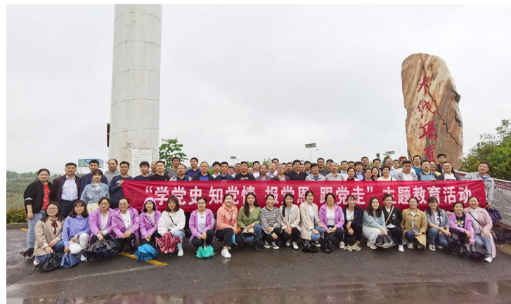
“学党史 知党情 报党恩 跟党走”主题教育活动