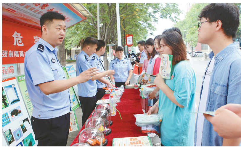
6月26日上午,市公安局联合市禁毒办、市疾病预防控制中心、河南省第二强制隔离戒毒所、共青团漯河市委,在漯河职业技术学院开展以“防范新型毒品对青少年危害”为主题的禁毒宣传教育。活动当天,共发放宣传资料1200余份,受教育学生2300余人次。