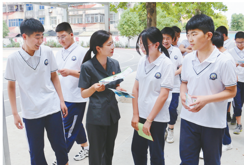
6月21日,舞阳县人民法院组织干警到县第二实验中学,为学生们普及法律知识。