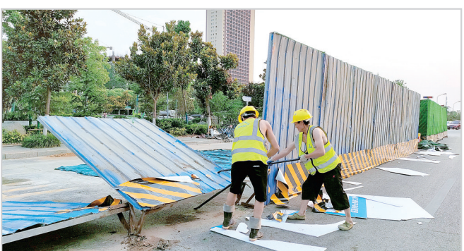
工人拆除嵩山东支路最后一段施工围挡。

市住建局一诺千金,如期拆除围挡,以实际行动履行了对市民的承诺,让民心工程更得民心,为党的百年华诞献上了饱含深情与汗水的贺礼!