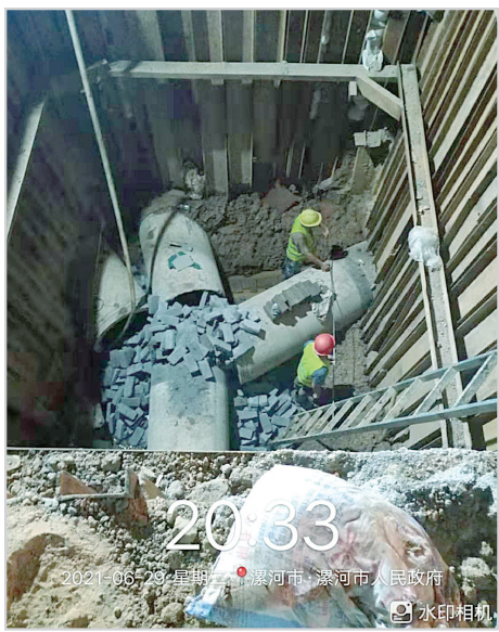
工人在放线备料,准备砌井。