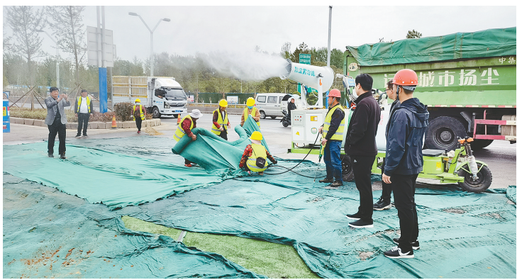
市场扬尘治理指挥部办公室督导组对施工现场扬尘管控措施落实情况进行督导。

记者走访发现,全市各类建筑工地严格落实扬尘治理标准,打造标准施工工地。在召陵区桐柏山