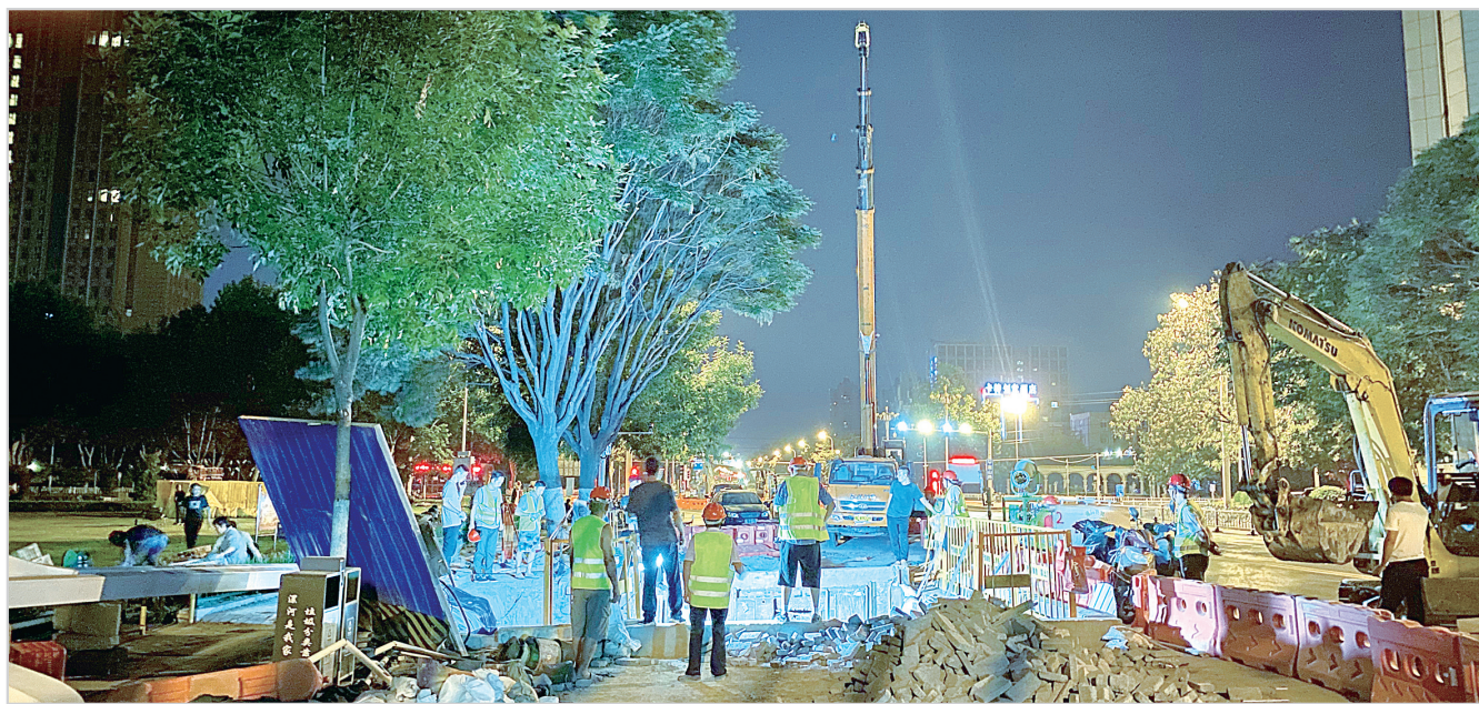
嵩山二标段嵩山路雨污分流工程最后一根混凝土管道完成顶进。

6月30日,记者在郾城区嵩山东支路看到,我市雨污分流工程(会展中心区域)施工四标段围挡如期拆除。