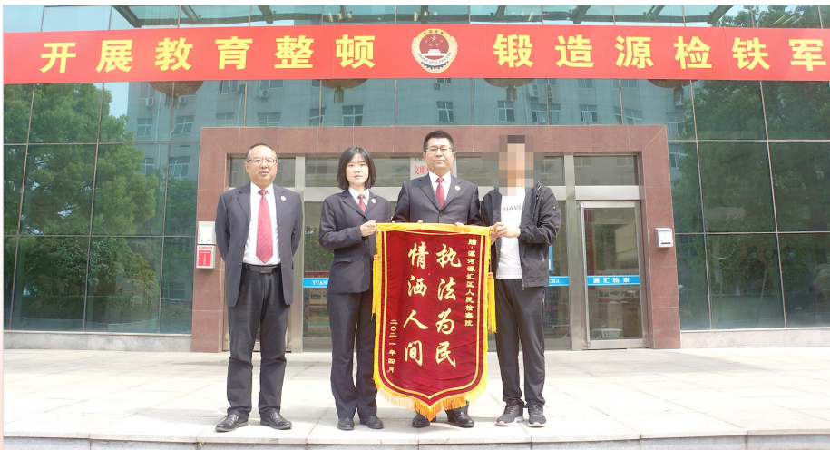
案件当事人向检察官送锦旗。