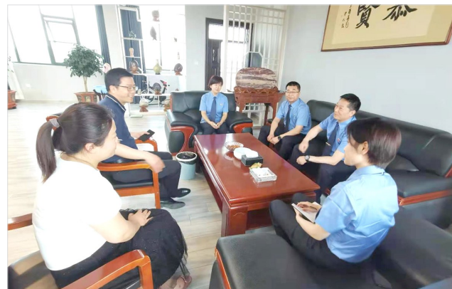
检察官走访企业了解诉求。