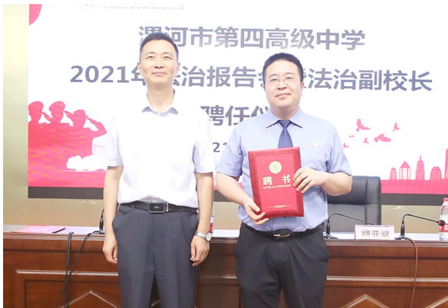
源汇区人民检察院党组书记、检察长胡亚斌被聘为漯河四高法治副校长。

政法队伍教育整顿开展以来,源汇区人民检察院秉持“办好案件就是最大的民生”的理念,坚持问题导向、目标导向、效果导向,采取一系列针对性强的举措,有效解