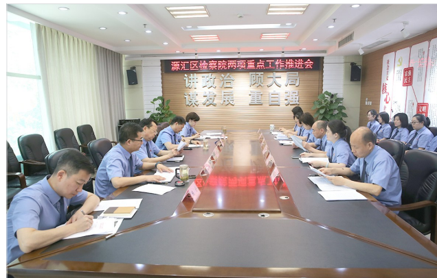
召开专题会议,研究降低“案-件比”和提高认罪认罚从宽制度适用率方法。