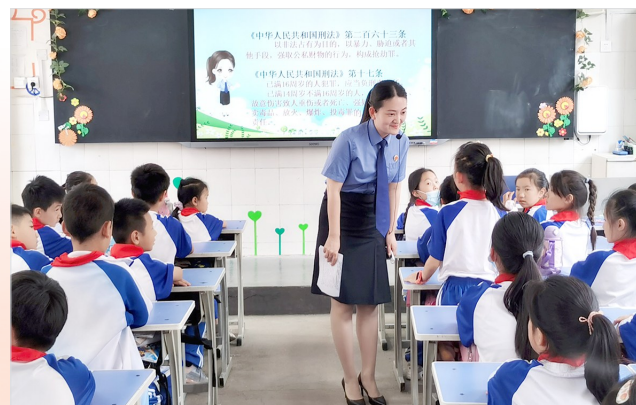
检察官送法进校园。