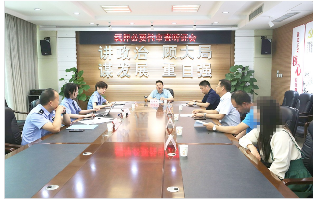
召开全市首例羁押必要性审查听证会。

数据显示:政法队伍教育整顿开展以来,源汇区人民检察院积极深入社区、乡镇开展法律志愿服务等活动,共开展法律宣传活动二十余次;化解涉法涉诉问题5个,办结4个;办理便民利民事项36件;化解企业难题5个,化解率100%;解决法律维权难题86个,解决优化营商环境难题8个。