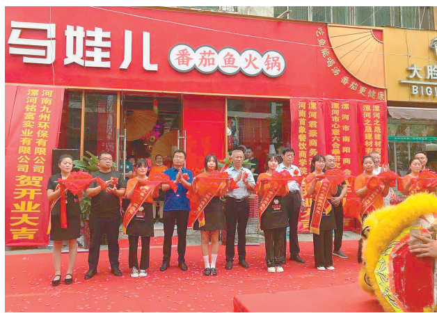
7月5日上午,位于太行山路与清河路交叉口的马娃儿番茄鱼火锅店开业,为市民提供一道夏日美味。