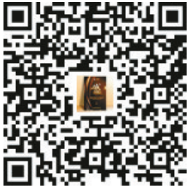
更多详情扫描上方二维码

范化、品牌化,漯河日报社、市消协将对我市婚庆行业优秀商家予以表彰。 此外,2021中原(漯河)首届婚博会主办方郑重承诺:在本次婚博会上,消费者如果遭遇消费陷阱,主办方将负责到底,确保市民放心消费。新人、商家报名电话:18703950738、13603959098。