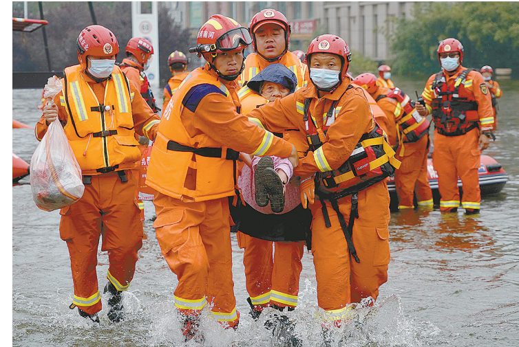
7月28日，在河南省卫辉市，消防救援人员转移被困老人。当日，河南省卫辉市的救援排涝工作仍在进行中，救援人员全力转移被困人员并进行排涝作业。

据了解，28日12时左右，卫河右岸从长虹渠重新流入的洪水和卫河左岸向白寺坡泄洪区流出的洪水流量基本接近。台风“烟花”已影响到鹤壁和安阳，滑县和浚县附近防洪形势严峻。