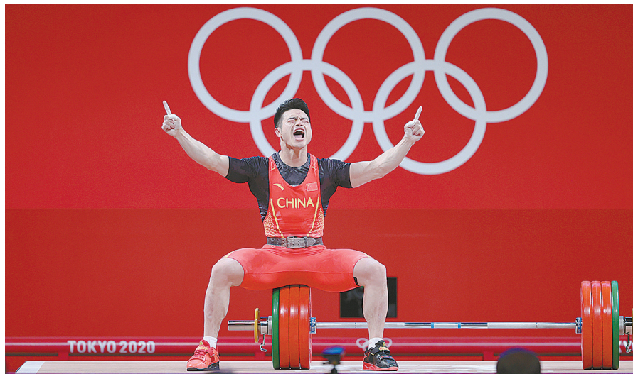
7月28日，中国选手石智勇在比赛中。当日，在东京奥运会举重男子73公斤级决赛中，中国选手石智勇夺冠。