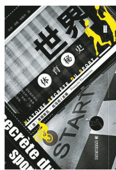
【法】弗朗索瓦·托马佐著 社会科学文献出版社

作者讲述那些远离聚光灯,却又对体育事业的发展影响巨大的人物与故事。 据《南方都市报》