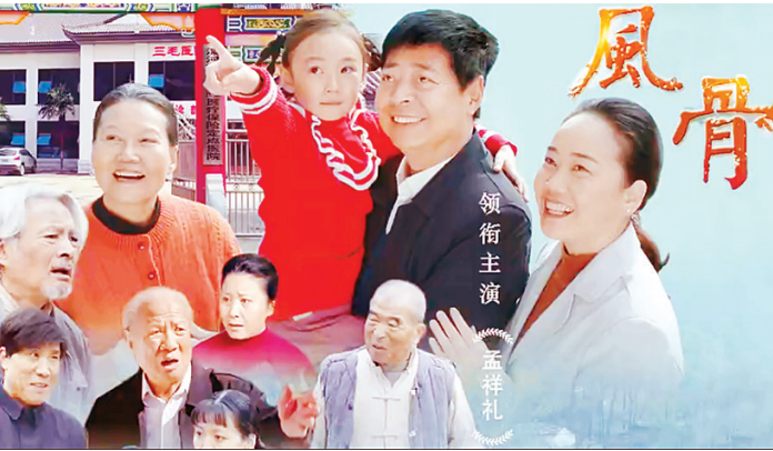
戏曲电影《风骨》海报。