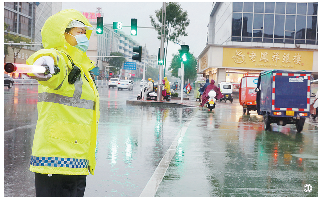
图① 8月22日下午,在人民路与交通路交叉口附近,交警冒雨指挥交通。 本报记者 尹晓玉 摄 图② 8月22日下午,源汇区城市发展服务中心安排专人在八一路涵洞、三尺门等易涝点值守,确保发现问题及时上报、处理。 见习记者 王嘉明 摄 图③ 8月22日上午,郾城区龙塔街道辽河路社区工作人员对辖区老旧房屋进行排查,确保居民的生命财产安全。 本报记者 姚晓晓 摄 图④ 8月22日下午,为应对新一轮强降雨,永信伯爵山小区物业公司在地下停车场入口处摆放沙袋。 本报记者 姚晓晓 摄

同时,也温暖了广大群众的心。 8月22日,市城市管理局综合执法支队对当天不影响城市道路通行的违停机动车,不予处罚。 8月22日,市区公交车于中午12:00全部暂停营运,漯河宏运汽车运输集团有限公司暂停所有跨省、跨市以及城多客运输车辆运行,漯河14家A级景区暂时关闭。 一场大雨,考验一座城市;一场大雨,展现出沙澧儿女的责任担当;一场大雨,让人们感受到了这座城市的温度。相信在市委、市政府的统一指挥调度下,在各职能部门的密切配合和分工协作下,我们一定能打赢这场防汛攻坚战,确保人民群众生命财产安全,让人民群众有更多获得感、幸福感、安全感。