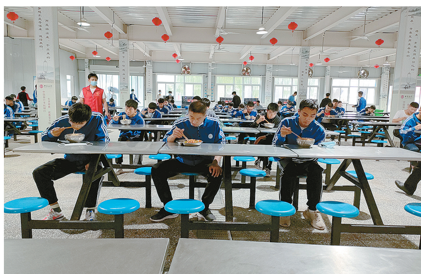
9月1日, 郾城高中学生隔座用餐。

据郾城高中校长王学儒介绍, 为充分做好开学准备, 该校8月28日开展了疫情应急处置模拟演练, 还对教学楼、宿舍、餐厅等进行全面消毒。为防止返校时出现拥挤, 高三年级12个班的810多名学生错峰错时入校。 中午, 记者在学校餐厅看到, 学生分批错时有序进入餐厅, 在教师志愿者的指引下排队洗手、打饭、隔座用餐。 据了解, 开学后, 郾城高中将实行小班制教学, 每班分为A、B两个班。任课老师交叉教学, 在两栋教学楼上课, 让学生们在安全距离内放心学习。