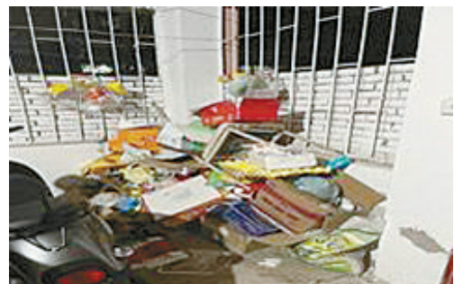
大学路税务局家属院, 有人在车子棚内堆放垃圾。