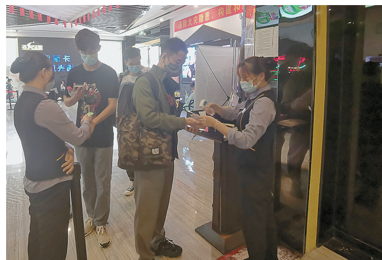
9月1日, 观众测温、扫码后进入昌建广场奥斯卡影院。工作人员告诉记者, 电影院已恢复正常营业。购票时, 系统通过锁定座位控制观众安全距离。入场前, 观众须佩戴口罩、扫码、接受体温测量。每场电影结束后, 工作人员会对放映厅进行全面消毒。