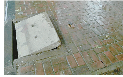
珠江路与韶山路交叉口向西约180米路南, 污水井盖移位。