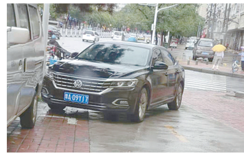
团结路与湘江路交叉口东北角, 车辆违停。