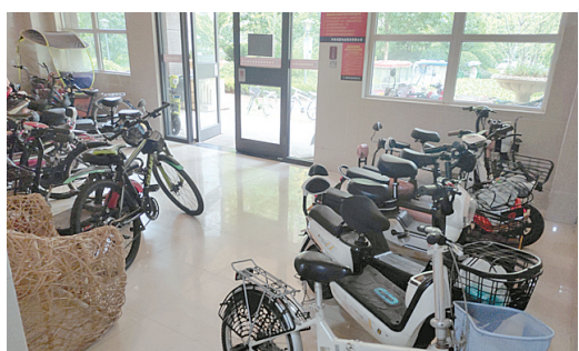
天鑫现代城小区,非机动车乱停乱放。