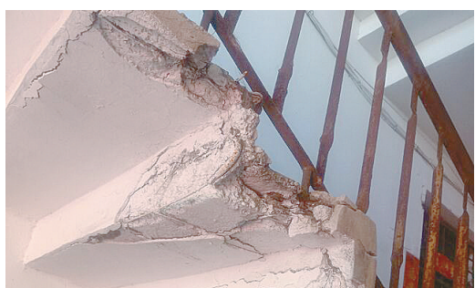
交通路宏运家属院4号楼,楼梯破损,有安全隐患。