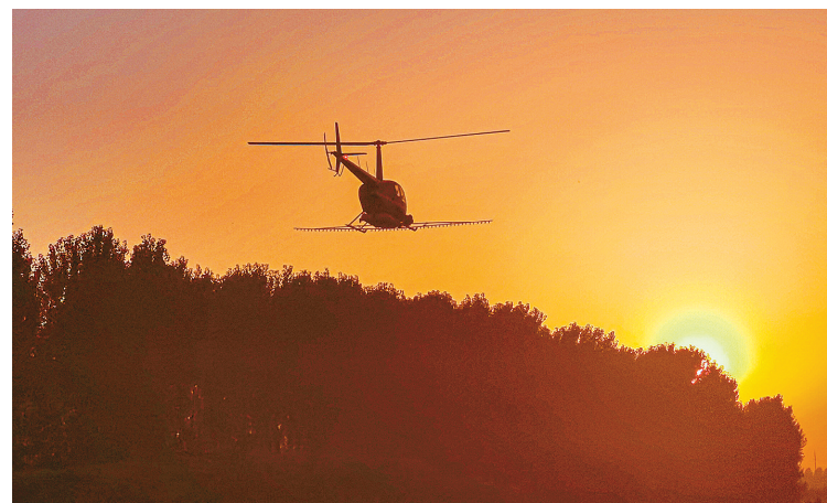
9月7日至10日,我市开展第三代美国白蛾飞防工作。本次飞防区域主要是国省干道、高速公路等,作业面积6.9万亩。