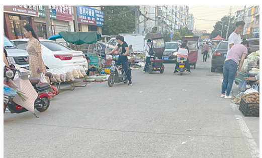
郟城建材市场,商贩占道经营。