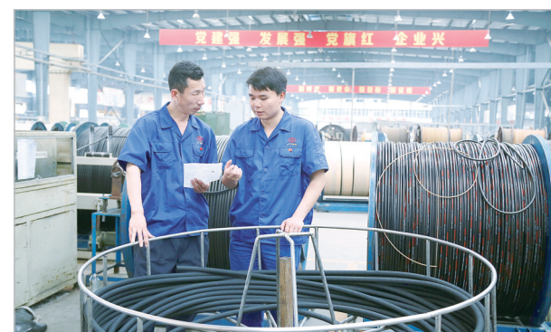
利通液压橡胶有限公司