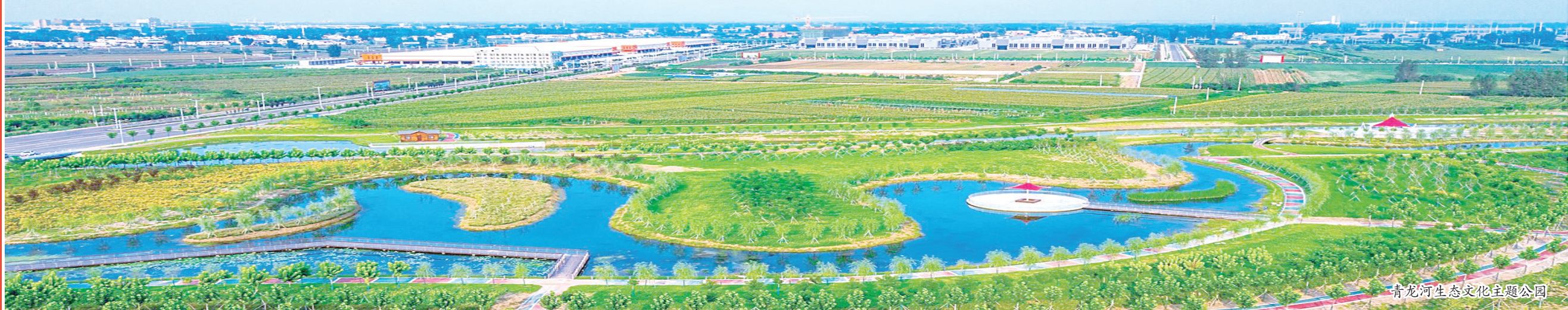
青龙河生态文化主题公园