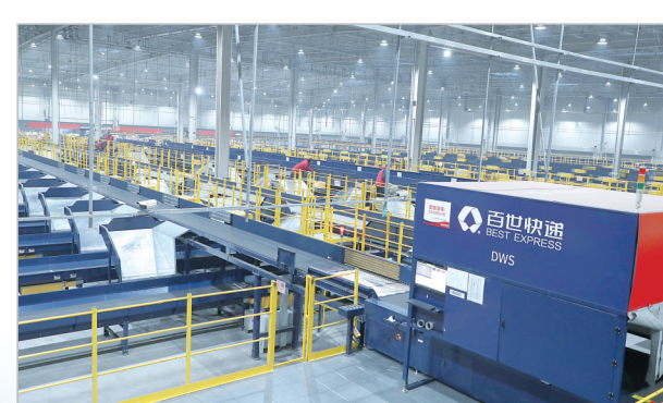
百世快递分拣车间