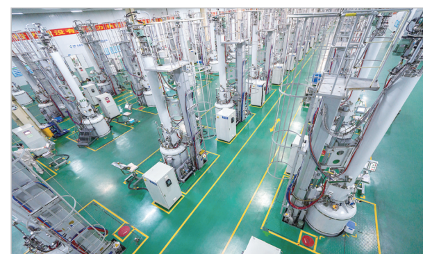
协鑫光伏生产车间