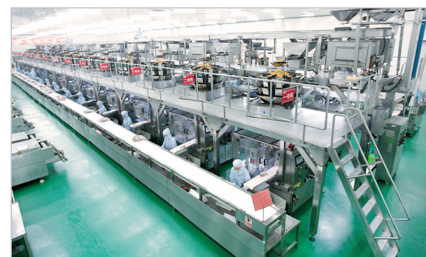
卫龙食品生产车间