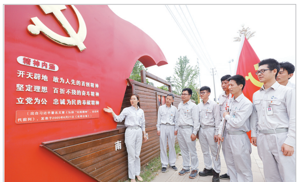
协鑫公司主题党日