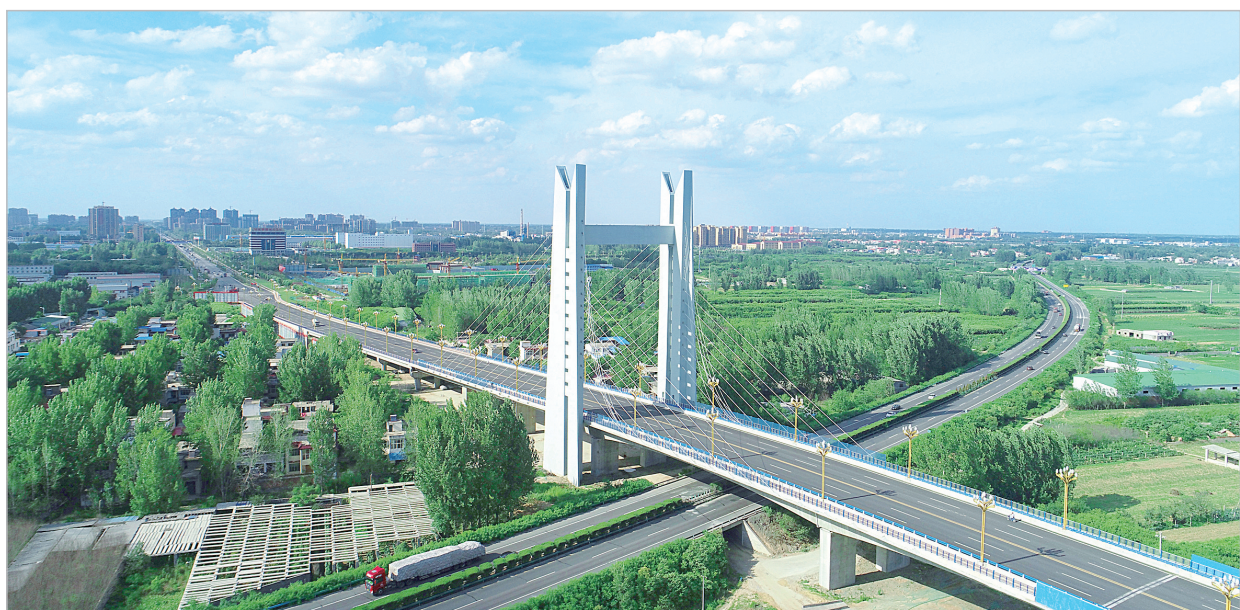
中山路上跨立交桥

“十三五”期间,在市委、市政府的正确领导下,经济技术开发区(以下简称“经开区”)坚持以习近平新时代中国特色社会主义思想为指导,坚持高质量发展根本方向,突出以发展工业实体经济为重点,坚定不移抓招商、上项目,全力以赴扩投资、稳增长,坚持不懈强创新、促转型,全心全意惠民生、增福祉,各项建设事业取得新进展、新突破。