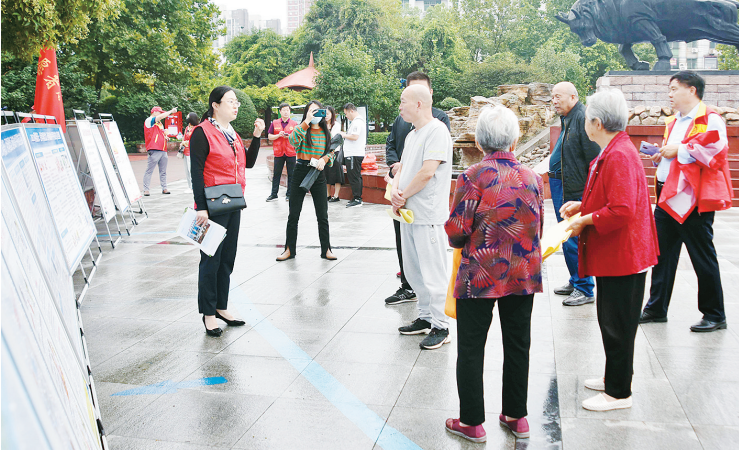
9月26日上午，郾城区委宣传部组织15家单位在黄河广场开展“文明实践之周末社科知识大集”活动。