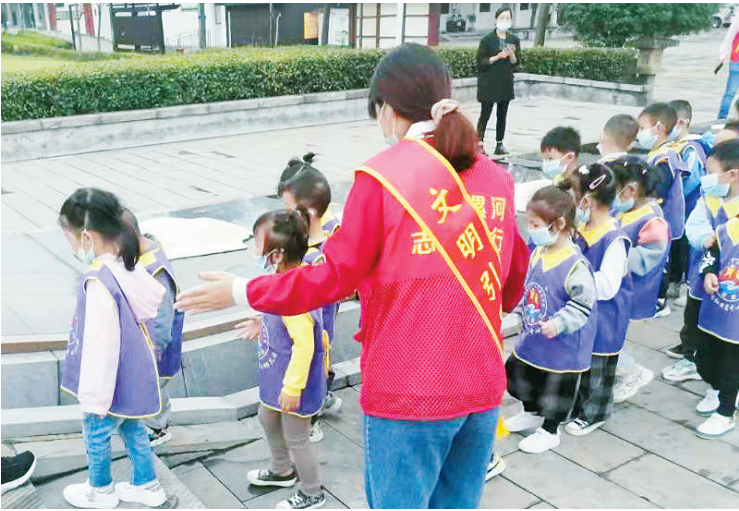
9月26日，在许慎文化园景区，工作人员引导小游客文明出行、有序参观。

本报讯（记者 张晨阳）为推动精神文明创建工作深入开展、践行社会主义核心价值观、传递好党的声音，今年以来，市委党校结合自身优势，充分发挥理论宣讲主渠道、主阵地作用，积极开展“党的创新理论宣讲进基层”活动，通过创新传播手段、丰富宣讲语言不断提升理论宣讲的针对性和实效性，让党的创新理论“飞入寻常百姓家”。 活动中，宣讲团成员紧扣学习贯彻习近平新时代中国特色社会主义思想和党的十九大精神，列好宣讲提纲，精心备课，提升宣讲的准确性、科学性。找到群众关切点、找准基层兴奋点，以“小话题”反应“大主题”，用“小故事”说明“大道理”，提升宣讲的吸引力、感染力，让老百姓喜欢听并听得懂党的创新理论，真正把党的创新理论带到基层，切实把全市上下的思想、行动统一到党的十九大精神上来，激发大家干事创业的热情；有效聚合报纸、电视等媒体资源，用足用好各类宣传阵地，对宣讲活动进行全方位报道，让理论宣传“唱起来”“跳起来”“活起来”，使党的创新理论宣传无处不在，滋润群众心田。 截至9月20日，市委党校已经开展“党的创新理论宣讲进基层”活动67场，取得良好反响，推动了党的创新理论深入基层、深入人心。