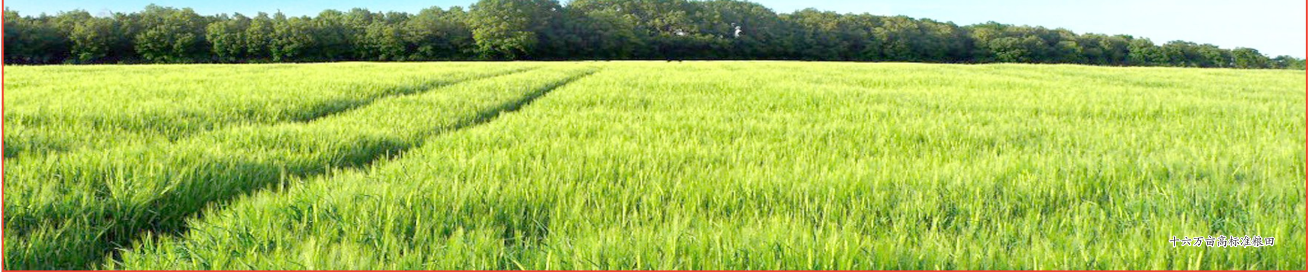
十六万亩高标准粮田