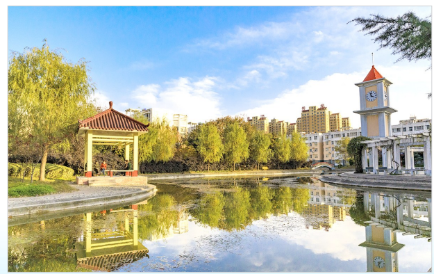
生态宜居的水榭花都小区