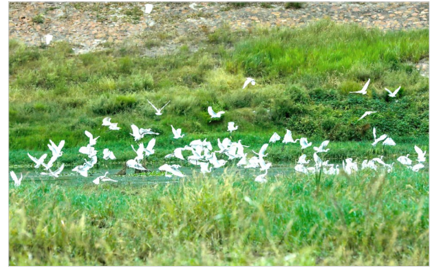
国家沙河湿地公园

发展的目的是更好的惠及民生。今年上半年,该县共完成民生支出8.52亿元,占一般公共预算支出的70.3%。就业形势平稳向好。多渠道促进居民就业,新增城镇就业4397人,失业人员再就业2143人。教育事业加快发展。“四校五园”项目加快推进,第五实验小学如期开学,中山路幼儿园即将建成,“大班额”问题得到有效化解;研究出台了支持高中教育的一揽子政策,加大奖励激励力度,高考本科上线率再创历史新高,特别是实现了十多年来该县“清北”生零的突破。医疗服务水平持续提升。县中心医院病房大楼、县人民医院公共卫生医学中心主体工程已完工,县妇幼保健院新院区等项目加快推进;坚决打好疫情防控阻击战,扎实做好重点部位防控、协查排查、集中隔离、核酸检测、疫