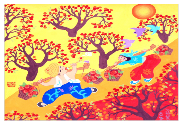
舞阳农民画作品《万柿如意》

苗接种等工作,为推动经济社会发展提供了保障。文体事业更加繁荣。贾湖遗址环境整治、贾湖保护利用设施建设工程完工,贾湖田园综合体研学基地、农民画院和14个足球场建成投用,举办村级文化活动120场次,群众精神文化生活更加丰富。