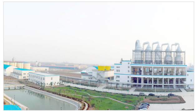
中盐舞阳盐业有限公司