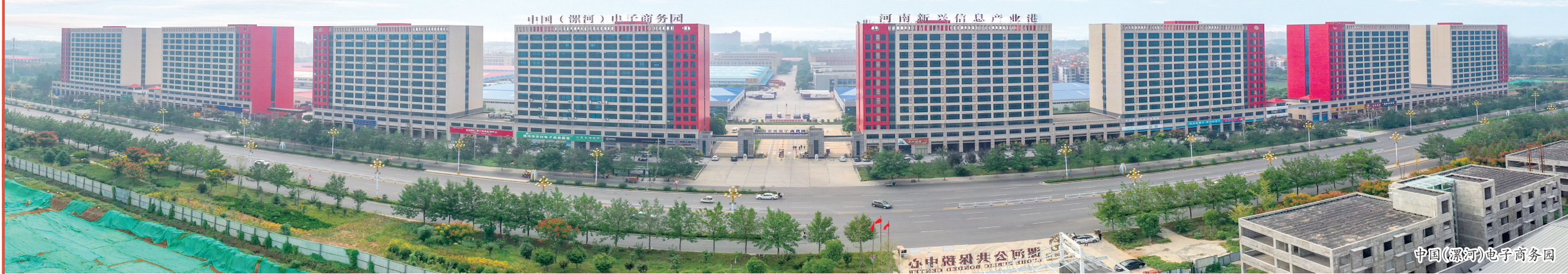
中国(漯河)电子商务园