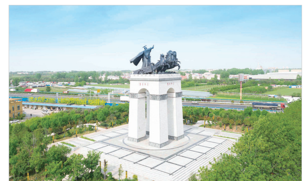
“召陵会盟”主题构筑物

跨越发展蓝图美,扬帆奋进气象新。新阶段开启新征程,新使命呼唤新作为,召陵区将以昂扬向上的斗志、攻坚克难的勇气、务实重干的作风,接续奋斗、砥砺前行,奋力谱写新时代召陵更加出彩的绚丽篇章。