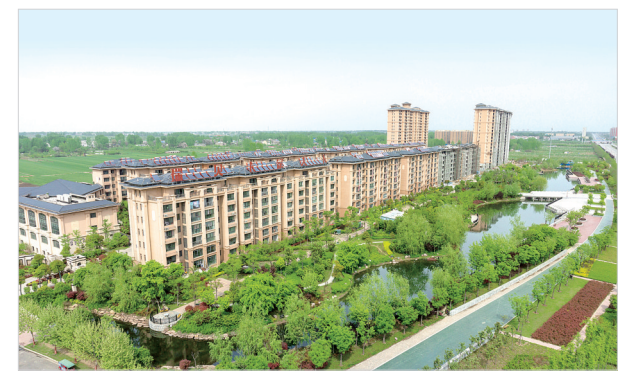
环境优美的居住小区