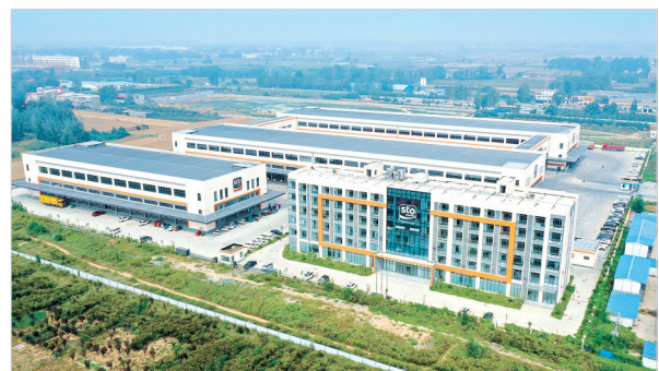
申通快运分拣中心