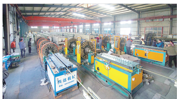
亿博橡胶科技有限公司生产车间

创建省级美丽小镇2个、人居环境示范村6个。改造农村户厕2万多户,乡村环境实现净、绿、美。