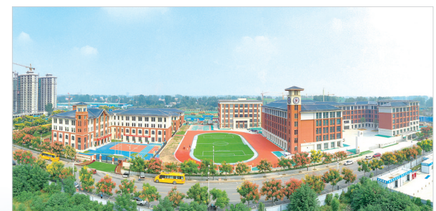
河南省实验学校漯河小学