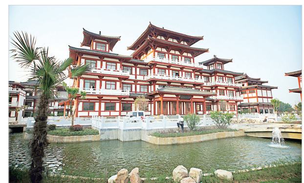
周彦生艺术研究院