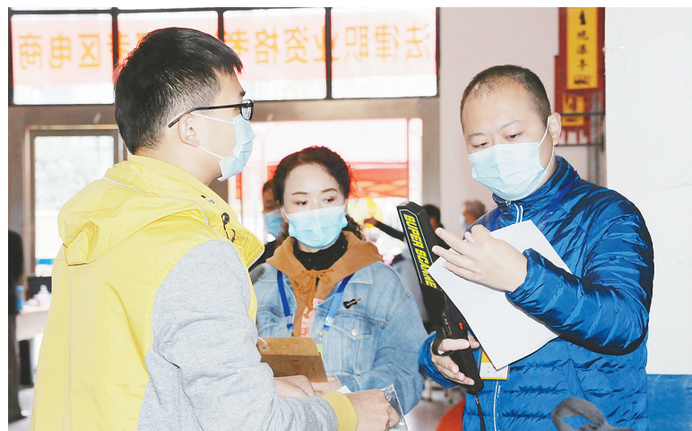
监考人员认真核查考生身份信息。