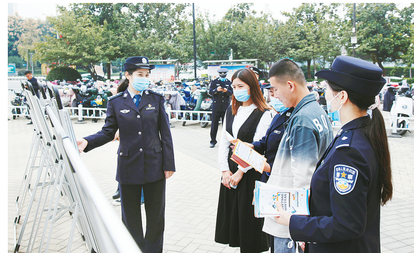
10月14日,市公安局在嵩山路市行政服务中心门前空地开展了以“网络安全为人民,网络安全靠人民”为主题的网络安全宣传周法治日活动。