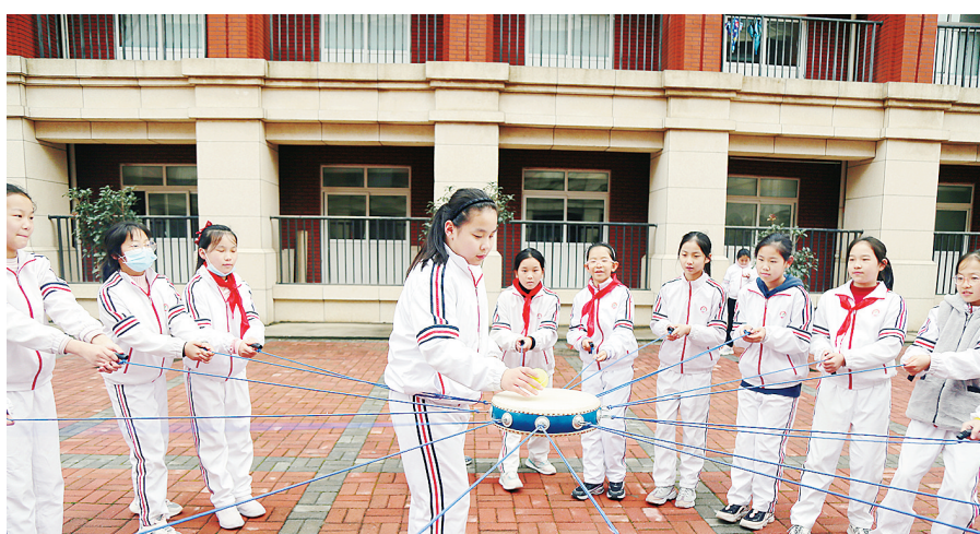
10月20日,市实验小学组织学生到市示范性综合实践基地举行以“助力‘双减’ 觅真趣 雏鹰展翅翱翔”为主题的秋季综合实践和研学活动。本报记者 刘岩 摄