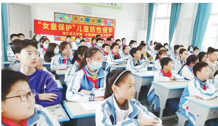
10月19日,市妇联组织人员到源汇区柳江路小学,举办以“爱护我们的身体”为主题的健康知识讲座。

该校在订阅号开辟党史学习教育栏目,定期推送市委组织部、市委党史和地方志研究中心等部门联合摄制的“追忆初心 红映沙湾”《百年百人》《党史百讲》系列微视频,汲取党史营养,凝聚时代力量。