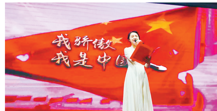
近日,漯河二高举办“青春无悔 强国有我”诗歌朗诵比赛。

手脱颖而出,进入“飞花令”终极决赛。赛场上,选手们临危不惧,展现出了良好的应变能力以及丰富的诗词储备。