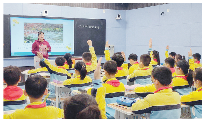
10月11日至20日,源汇区实验学校举办了优质课大赛。