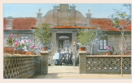
1919年更名为善济医院。