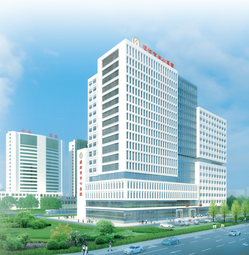
市中心医院规划图。