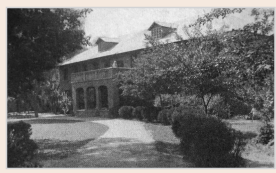
1931年更名为郾城卫生疗养院。