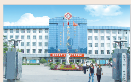
1989年，医院搬迁至现址。