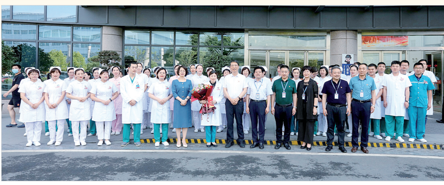
市委书记刘尚进、市委常委、组织部部长吕珊珊同市中心医院抗疫医护人员。

“沙河东流碧，螺湾汇双河。”在市区滨河路中段，碧波荡漾的沙河南岸，静静伫立着一座米黄色的建筑，它曾是漯河市中心医院（漯河医专一附院、漯河市第一人民医院）的前身——创建于1916年的安息日教会诊所。