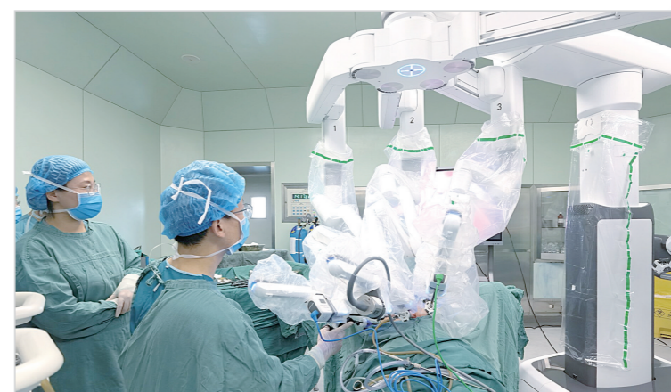
市中心医院医生正在利用“达芬奇”手术机器人进行手术。