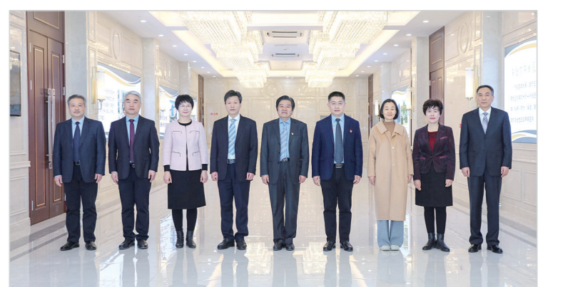
市中心医院领导班子。

该院成为国家级住院医师规范化培训基地、国家级全科医生培养基地、国家级临床药师培训基地、国家级卒中防治基地、全国妇产科内分诊和妇科常见病诊疗培训基地，河南省首批开展神经介入介入、外周血管介入和综合介入诊疗技术的医疗机构，豫中南唯一一家准予开展人工授精—胚胎移植及卵泡浆内精子注射技术的医疗单位。该院设有河南省高血压防治中心漯河分中心、河南省小儿重症救治网络中心漯河分中心。急救中心被评为省级紧急医学救援队。肿瘤科荣获获