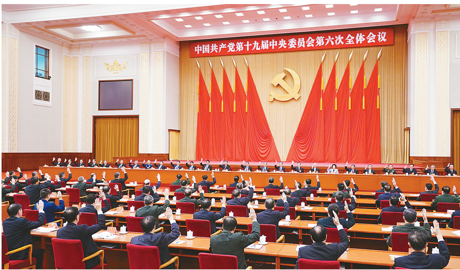
中国共产党第十九届中央委员会第六次全体会议,于2021年11月8日至11日在北京举行。中央政治局主持会议。

新华社北京11月11日电 中国共产党第十九届中央委员会第六次全体会议公报 (2021年11月11日中国共产党第十九届中央委员会第六次全体会议通过) 中国共产党第十九届中央委员会第六次全体会议,于2021年11月8日至11日在北京举行。 出席这次全会的有,中央委员197人,候补中央委员151人。中央纪律检查委员会常务委员会委员和有关方面负责同志列席会议。