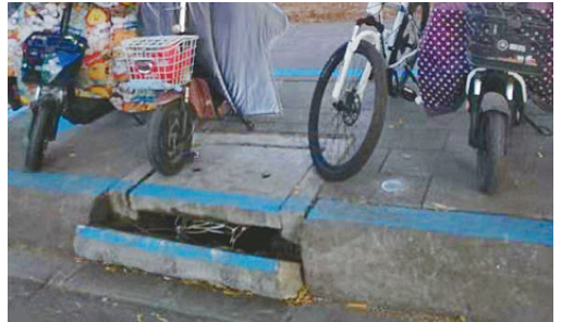
淞江路与祁山路交叉口向东约130米路北,下水道受损。