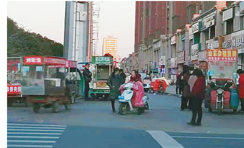
柳江路鹤山路交叉口东南角,流动商贩占道经营。