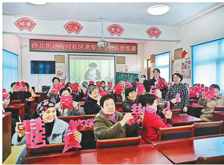
12月2日,郾城区沙北街道海河社区在社区活动室开展“文化传承 趣味剪纸”老年大学公益剪纸活动。