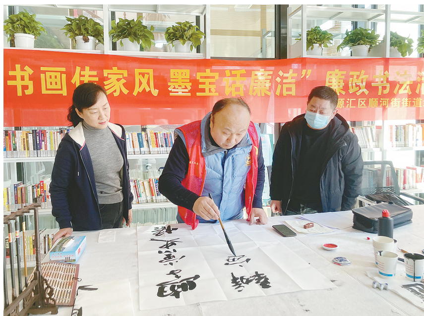
12月3日,源汇区顺河街街道党工委在顺河街街道“清风书屋”开展“书画传家风 墨宝话廉洁”廉政书法活动。