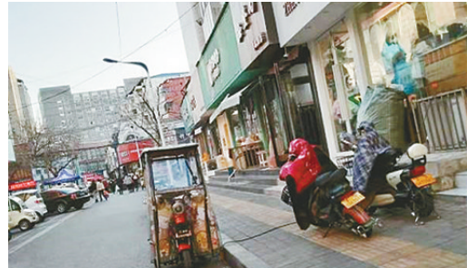
新华街与马路街交叉口向北约30米路旁,车辆乱停放,私拉电线充电。