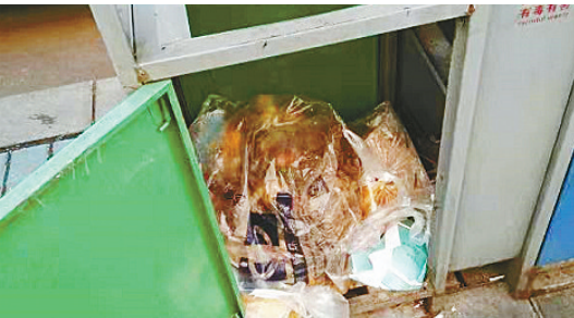
辽河路与舟山路交叉口向东约100米路北，垃圾箱内胆缺失。