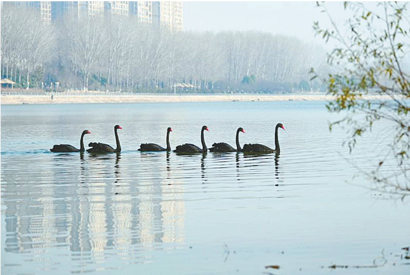
12月22日，6只黑天鹅在沙河中畅游。