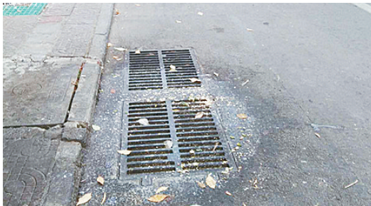
柳江路与嵩山南路交叉口向东约140米路北，有人乱倒泔水。