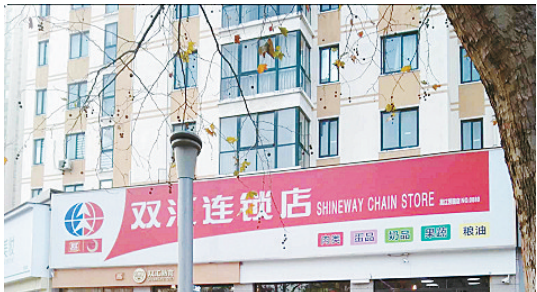
嫩江路与嵩山西支路交叉口向西约30米路南，人行道上路名牌缺失。