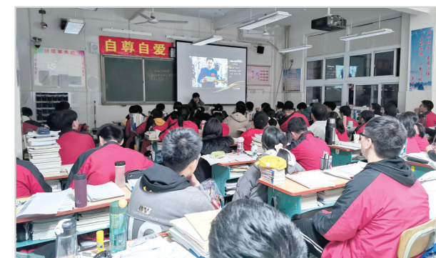
学生观看思政视频。