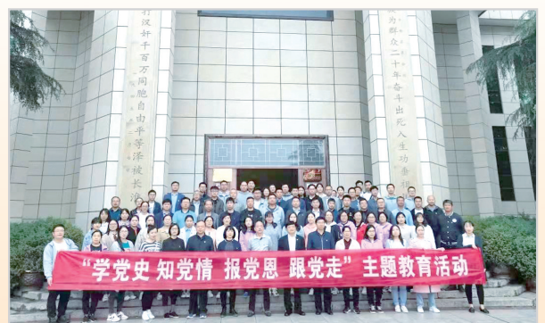
“学党史 知党情 报党恩 跟党走”主题教育活动。

在“学习”中思政。针对学生校外时间少、缺乏了解时政新闻的渠道等问题,学校创办了《漯河高中思政新闻周刊》,将政治性、理论性、教育性、趣味性等内容结合,组织学生自己录制党史学习教育系列短