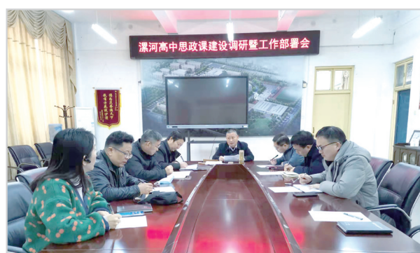
学校召开思政课建设调研部署会。