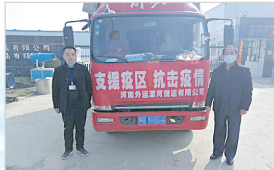
新冠肺炎疫情期间向武汉运送物资