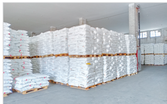
仓库内货物摆放整齐