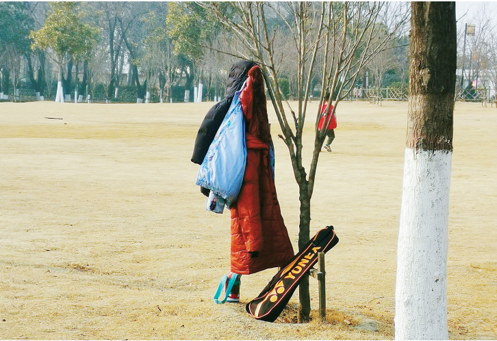
1月3日，沙澧河风景区，游客将衣物挂在树上。 曝光台