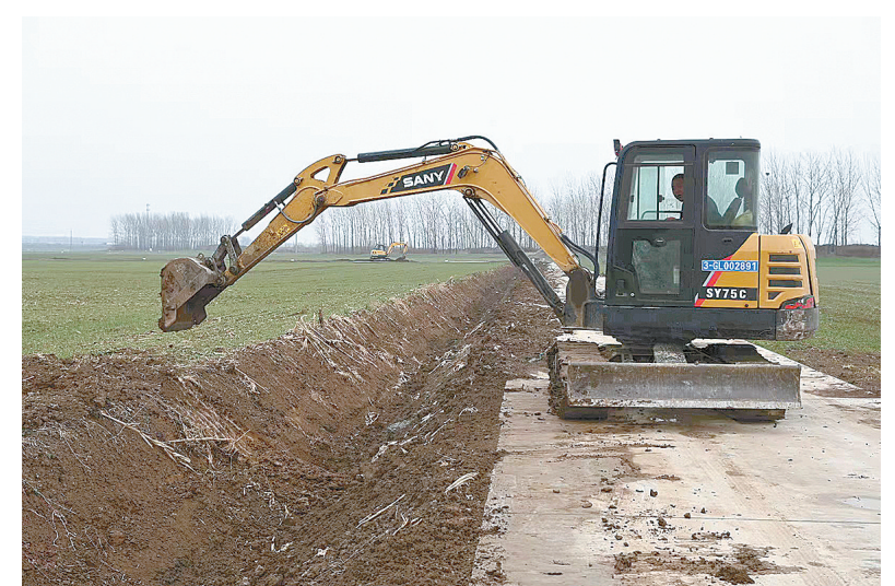
1月6日,黑龙潭镇张德武村村民在整修沟渠。入冬以来,市城乡一体化示范区积极开展农田水利“夏病冬治”建设行动,进一步提高农田防汛排涝能力,为农业增产、农民增收提供坚强保障。