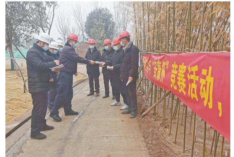
近日,西城区对环境水系统施工现场进行封闭管理,严格落实各项防疫要求。图为水生态项目部工作人员给作业人员发口罩。