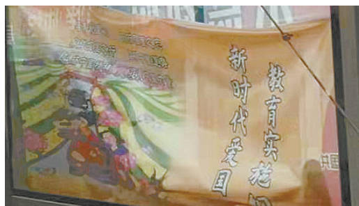
建设路与文化路交叉口向西约15米路南,公交站牌上的公益广告脱落。