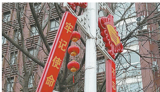
汾河路与中山北路交叉口向东约80米路南,景观灯倾斜。