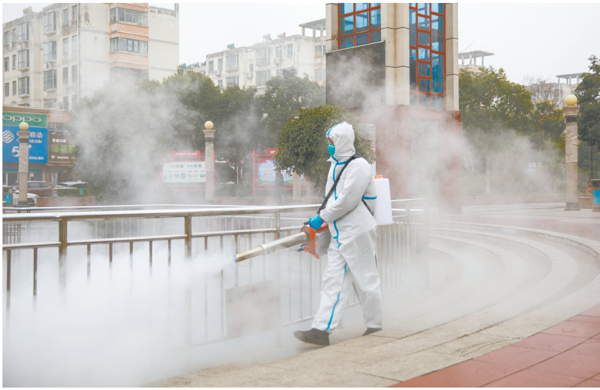
1月10日,共青团漯河市委中青应急救援队和郾城区青年志愿者协会的志愿者,对钟楼广场和附近小区进行全面消杀。

■见习记者 刘净诗 “大家好!现在社区特招党员、大学生参与疫情防控。居民们如有时间,请积极报名。”1月7日,郾城区沙北街道泰山社区的工作人员在微信群里发布了招募志愿者的消息,立刻得到居民的响应。大学生罗颖和宋怡星就是其中的两位。 从1月8日开始,罗颖和宋怡星每天下午2点到小区的主要出入口,开展疫情防控值勤工作。 “你好,麻烦出示一下健康码。”1月10日,在黄山路与支四路交叉口,记者看到罗颖和宋怡星向进入小区的居民查验健康码。 “00”后的罗颖是河南师范大学大二学生。“作为社区的一员,我也有责任守护我们的家园。”罗颖说,看到社区招募志愿者的消息后,当即就报了名。 宋怡星是南阳医学高等专科学校大一学生,也是一名“00后”,看到招募志愿者的消息便报了名。 目前,该社区已有30余名党员和大学生报名参加疫情防控工作。