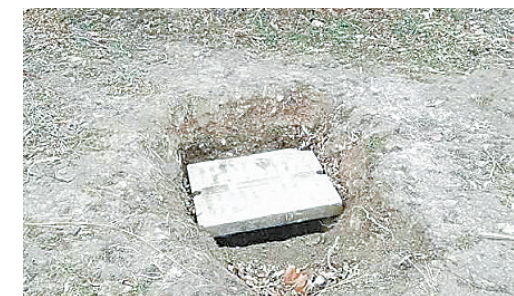
湘江西路与太白山南路交叉口向西约50米路北,绿化带内窨井盖没有盖好。